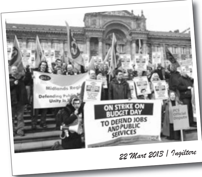
22 Mart 2013 | İngiltere

Başta Avrupa ülkeleri olmak üzere sosyal hak gasplarıyla karşı karşıya bırakılan işçiler direnişlerini grevlerle büyütüyor. Sermayenin saldırılarına karşı mücadeleyi büyüten Polonya işçileriyle bölgesel genel greve çıkarak sınıf dayanışmasının güzel bir örneğini sergilediler.