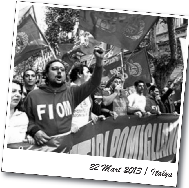
22 Mart 2013 | İtalya

İtalya'da Cuma günü ülke çapında toplu taşıma araçları çalışmadı, yolcu taşımadı. FILT-CGIL sendikalarının çağrısına uyan toplu taşımacılıkta çalışan işçiler ve emekçiler Cuma günü greve gittiler.